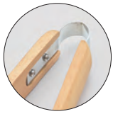
※01~06ステンレスばね仕様