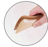
05-06 細かいものには、ひっくり返してつまむようにご使用いただけます。